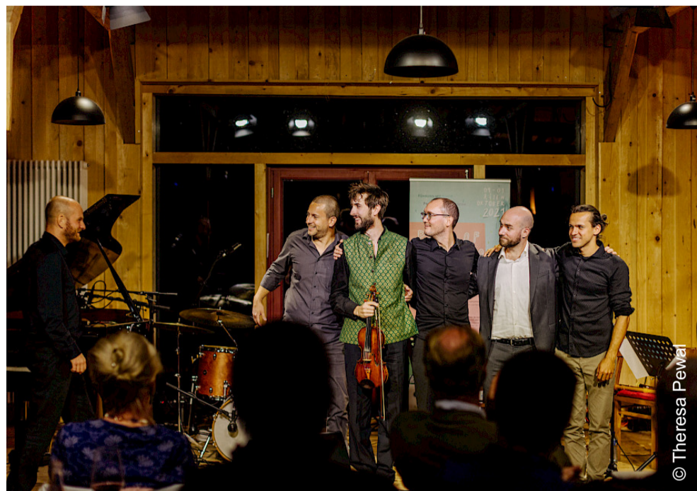
Foto: Sebastian Wienand, Alexander Wienand, Florian Willeitner, Ivan Turkij, Tabias Schirmer & Thibault Viviani

Das Konzert wird gefördert durch die Niedersächsische Sparkassenstiftung und die Sparkasse Emsland.