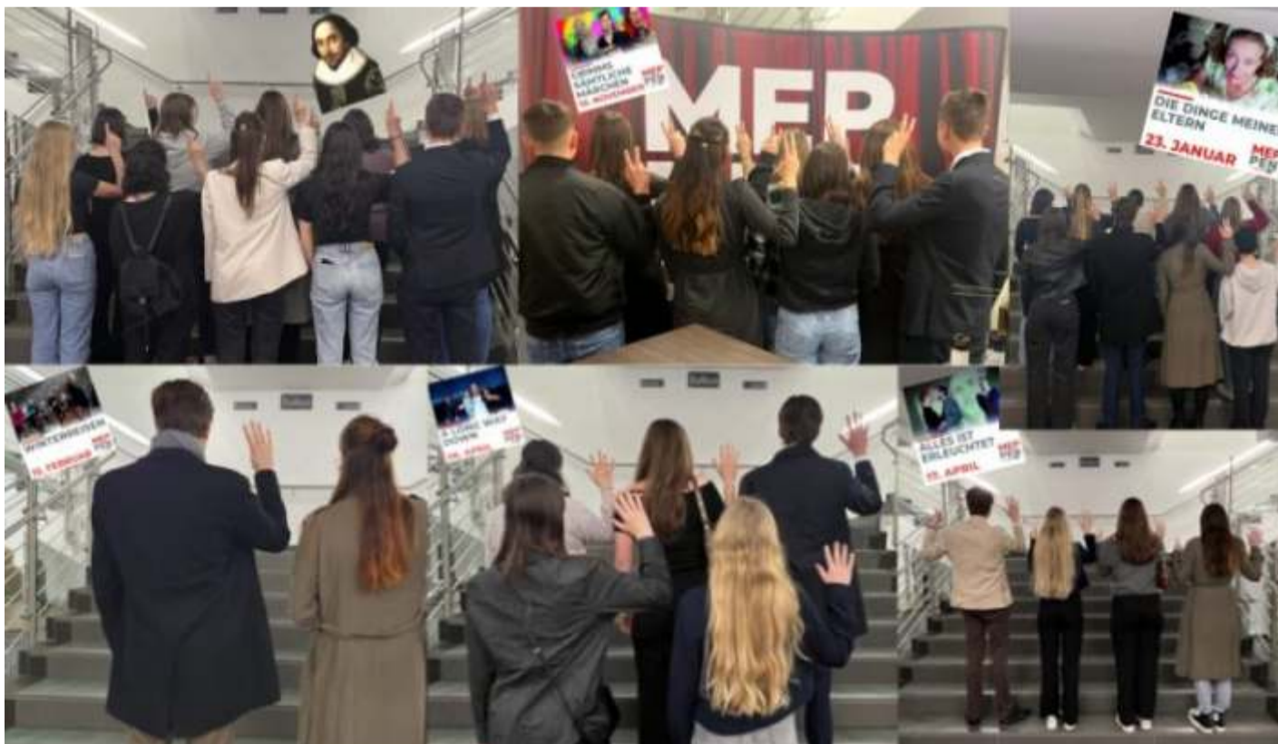
Foto: Schüler*innen des Gymnasiums Haren im Theater Meppen

Das Angebot der Theatergemeinde Meppen stellte eine sehr erfreuliche Erfahrung dar, durch welche sich die Begeisterung für das Theater jahrgangsübergreifend entfalten konnte. Wir alle freuen uns darüber, dass wir an diesem Projekt teilnehmen durften und bedanken uns ganz herzlich bei der Theatergemeinde Meppen. Wir hoffen, dass dies nicht das letzte Angebot dieser Art war ;-).“