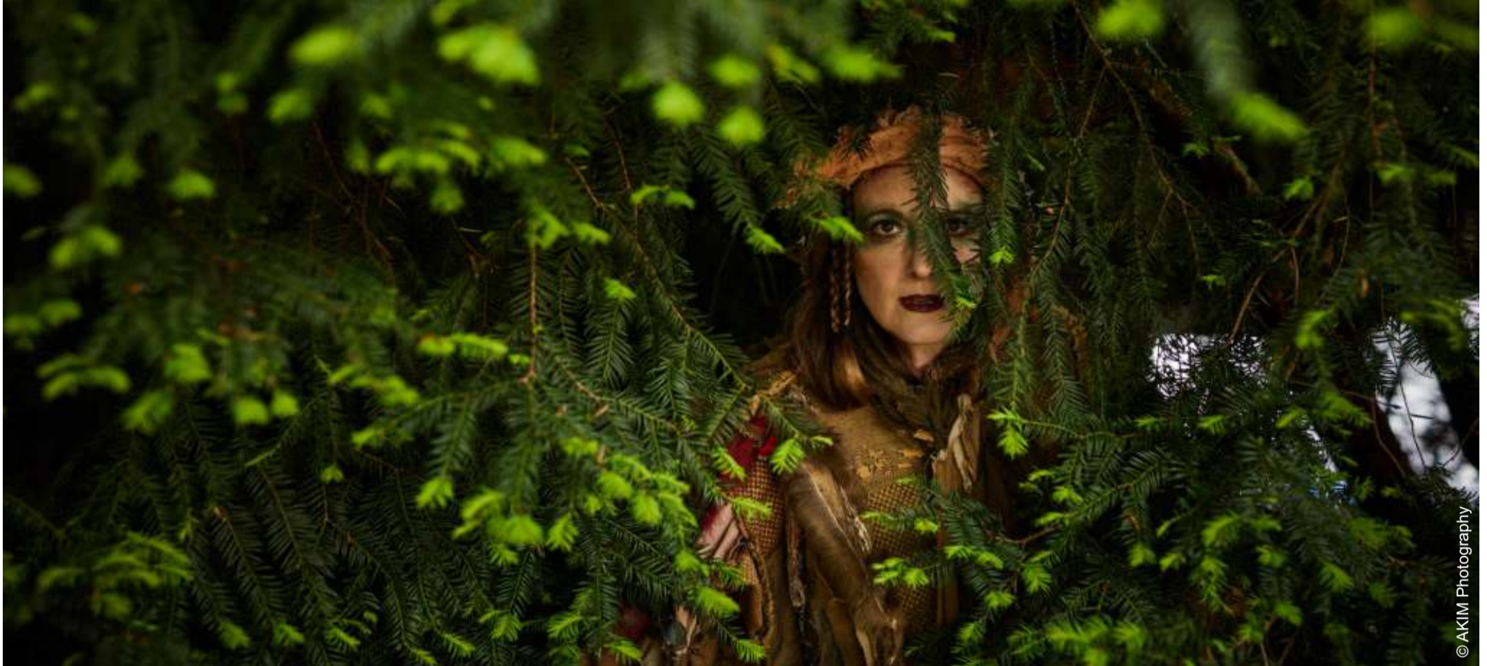
Foto: Werbebild zum Stück „Peer Gynt“ am 14.09.2024