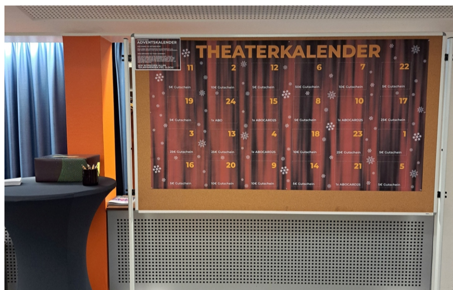
Foto: Adventskalender im Theater Meppen

Bereits seit einigen Tagen steht im Foyer des Theaters Meppen ein großer Adventskalender. Jeder Theaterbesucher hat die Möglichkeit einen Teilnahmezettel auszufüllen und diesen in die bereitgestellte Verlosungsbox zu werfen. Vom ersten bis zum 24ten Dezember wird jeden Tag ein Gewinner oder eine Gewinnerin aus dieser Box gezogen. Neben Gutscheinen im Wert von fünf bis 25 Euro können außerdem Abocards25 und als Hauptgewinn ein ganzes Abo nach Wahl für eine Person im Wert von 90 Euro gewonnen werden. Eine Teilnahme ist bis zum 20.12.23 möglich.