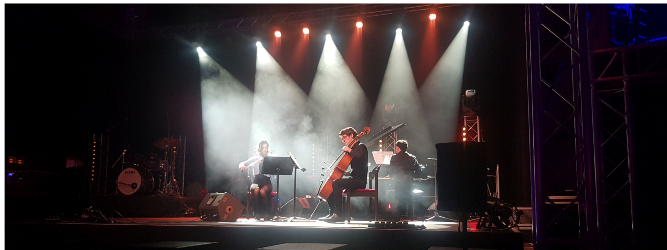
Foto: Bandauftritt bei Classic vs. Pop 2023 in Papenburg